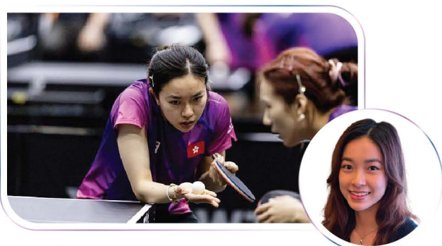
乒乓球 Table Tennis